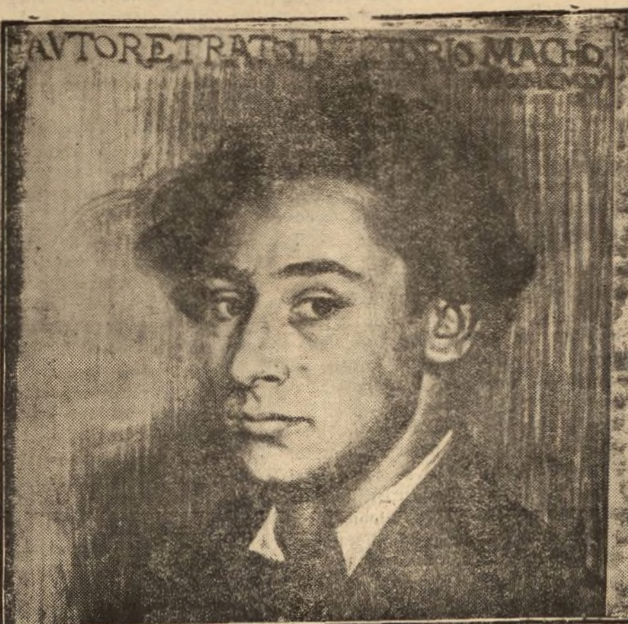
Victorio Macho. Autor del proyecto premiado del monumento a Cajal en Madrid. Dibujo autorretrato.