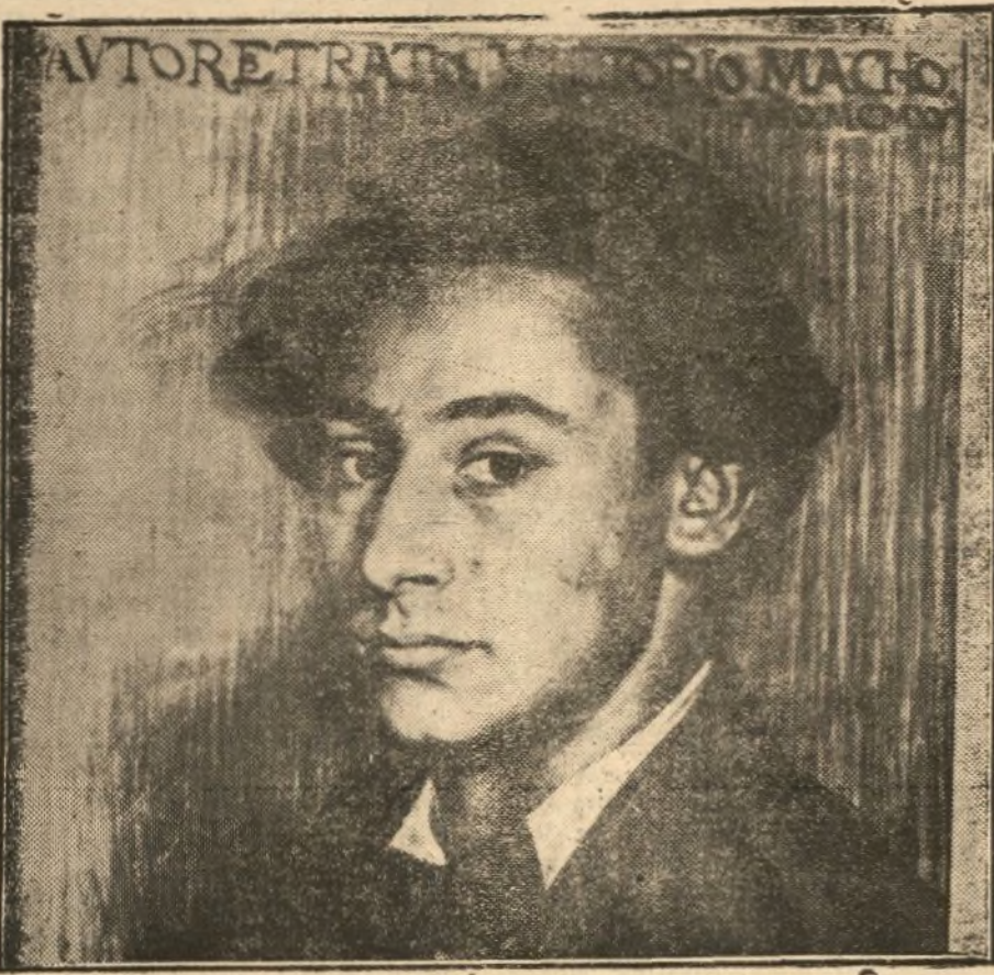
Victorio Macho. Autor del proyecto premiado del monumento a Cajal en Madrid. Dibujo autorretrato.