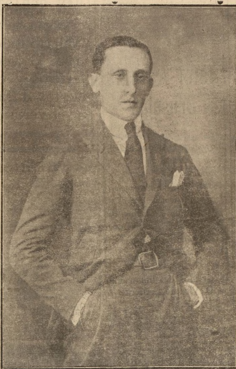
RAFAEL CALVO GUTIERREZ Notabilísimo actor del teatro Español