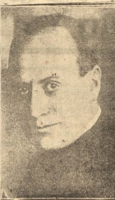
Mussolini, jefe del movimiento fascista

Ya se ha puesto en claro que el Ministerio Facta presentó su dimisión ante un ultimátum del Congreso fascista de Nápoles. En una nota oficiosa, redactada en términos ambiguos, trató de disimular que el Gabinete cayera, no en virtud de un voto parlamentario, más bajo la presión de una Liga desprovista de toda au-