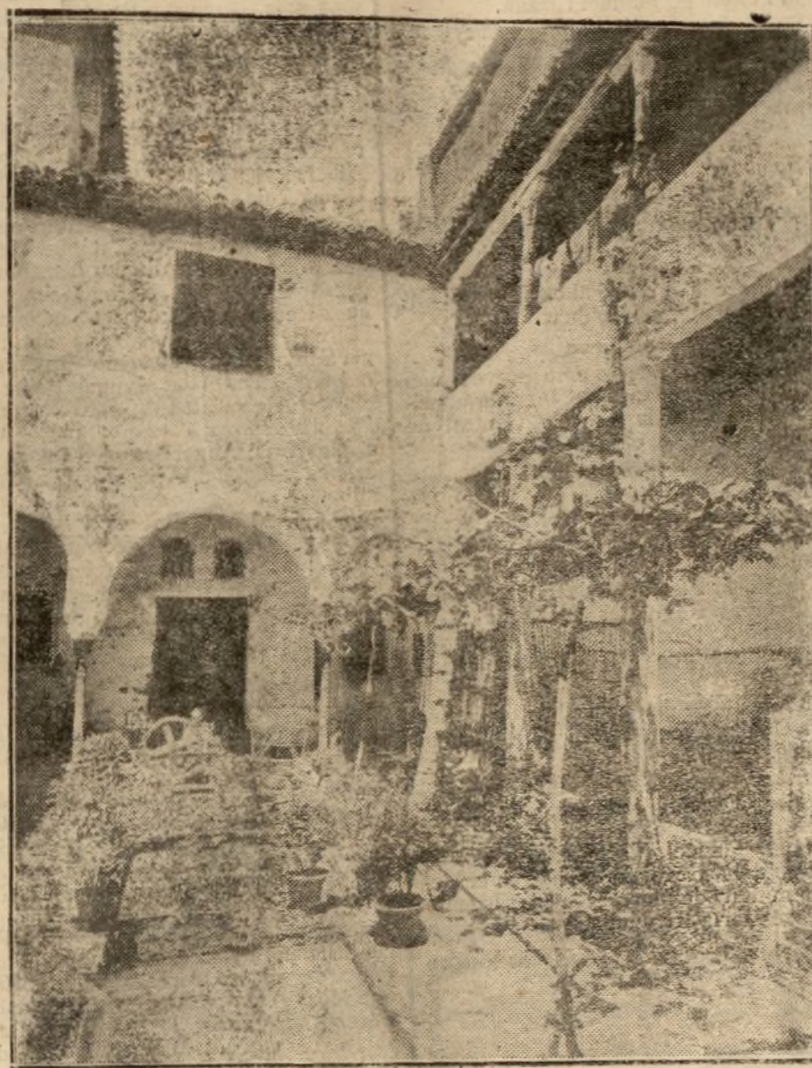
Patio de una casa granadina

MIRANDA 3.—Dicen de Rincón de Soto que a las doce de la madrugada ocurrió un choque entre el mercancías 1.807 y el mixto de Bilbao. Descarrilaron ocho vagones y quedó interceptada la vía. No hubo desgracias personales.