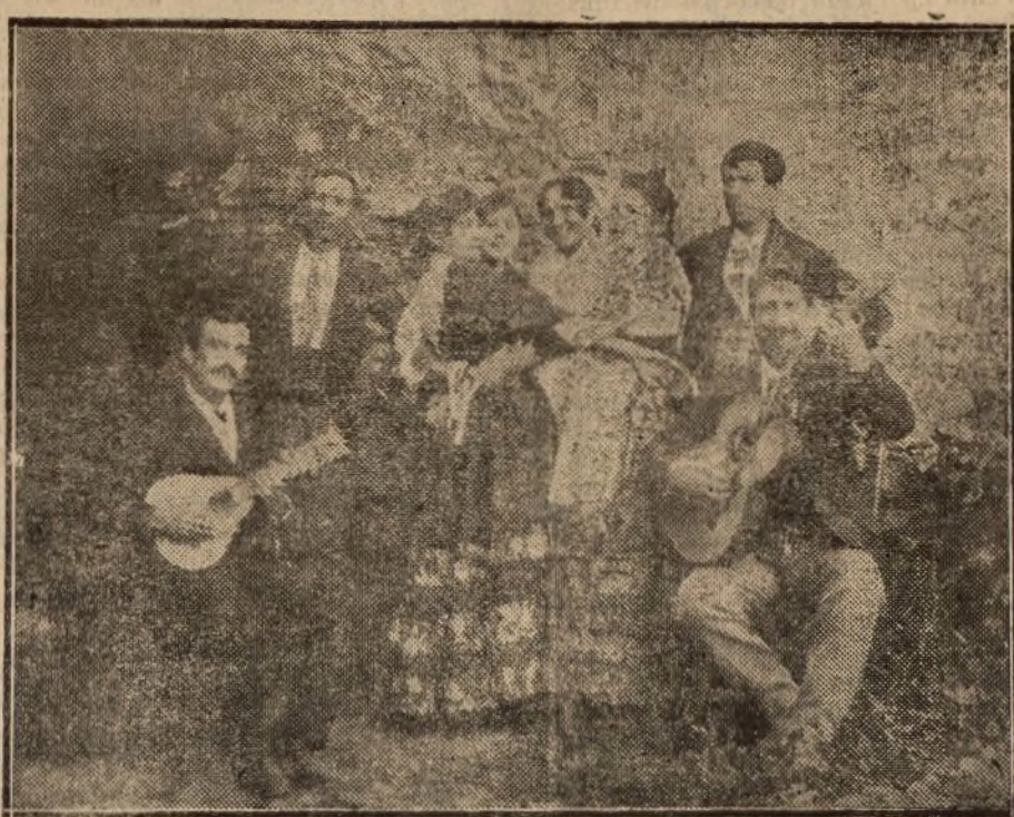
Una típica danza de gitanos del Albaicín

Tal es la opinión del «Reichsport», al afirmar que el fascismo ha dejado de ser una cuestión italiana de orden interior, para convertirse en un factor internacional de incalculable importancia. De todo lo cual desprende que, en las contingencias de la política europea, habrá que contar con el fascismo, nacido de ayer. En Austria, más que en parte alguna, sigue con interés apasionado lo que ocurre en Italia, con cuya nación los gobernantes austríacos tienden, de algún tiempo a esta parte, a estrechar las relaciones, confiados, tal vez, en explotar algún día las hondas divergencias que median entre Italia y Yugoslavia.