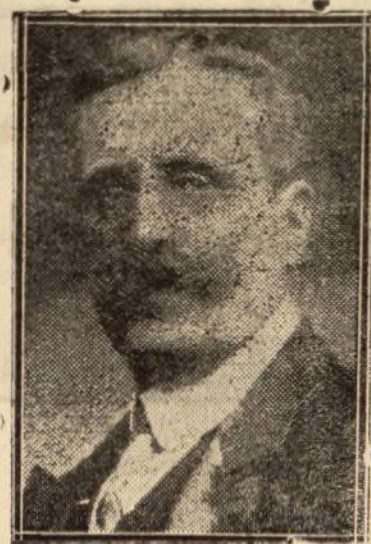
D. JOSÉ CANALEJAS Ilustre estadista de cuya muerte se cumplió ayer el décimo aniversario

P. siciones desmante adas LARACHE 11.—En vista de la tranquilidad que reina en la zona, ha dispuesto el general Sanjurjo que sean desmanteladas las posiciones de Ain Chak y Hadir.