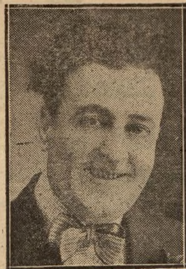
Gerardo de Nieva, notabilísimo actor español que está realizando una brillante tournée por los teatros de América