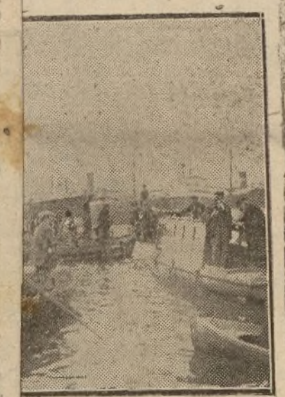
Juzgado de Marina actuando

vignorándose en cambio el paradericho joven. Se cree que pereció en el choque.