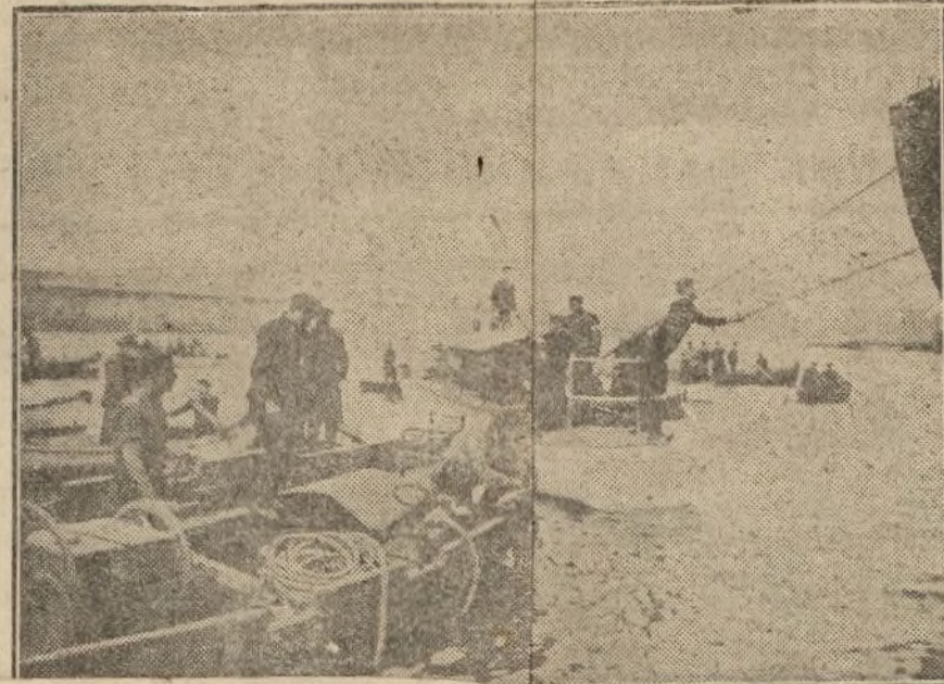
Los bufos acción