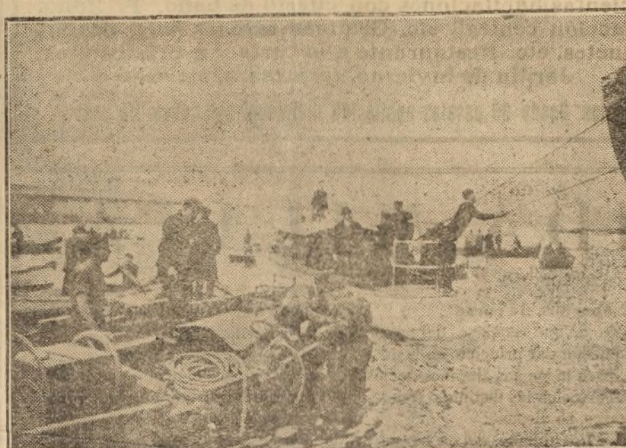
Los bufos en acción