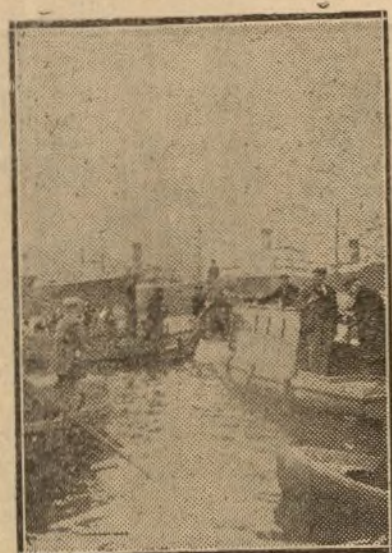
El Juzgado de Marina actuando

varon, ignorándose en cambio el paradero de dicho joven. Se cree que pereció en la catástrofe.