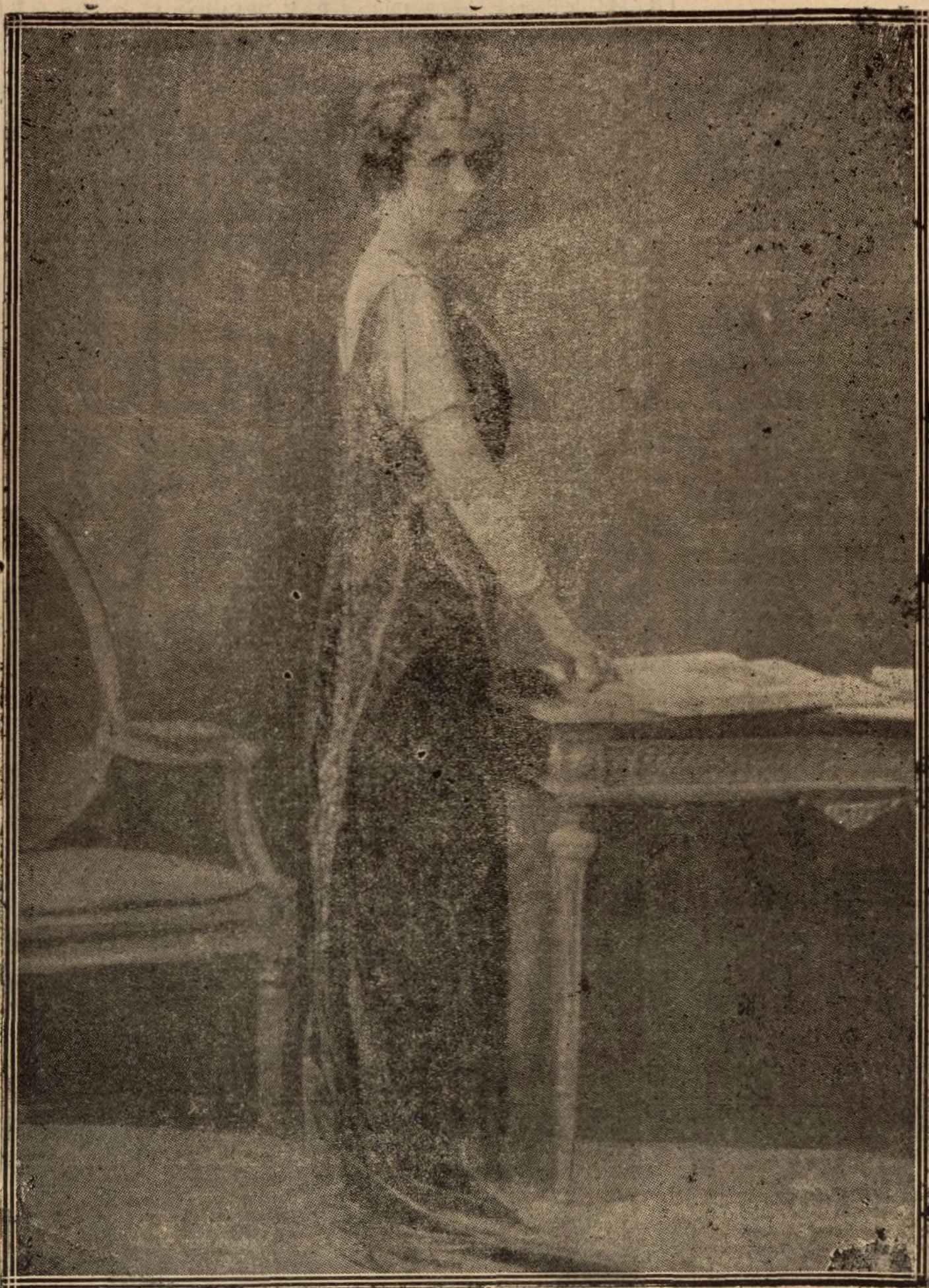
Su Majestad la Reina Doña Victoria Eugenia

El animal pesa 18 arrobas, y después de haber sido exhibido en el pueblo, donde lo han contemplado centenares de curiosos, se ha enviado a Jerez, consignado a los marqueses de Hoyos.