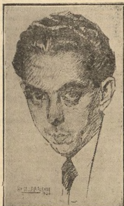
«Don Luis», crítico taurino de «El Liberal», autor del libro «Toros y Toreros» que está obteniendo gran éxito.