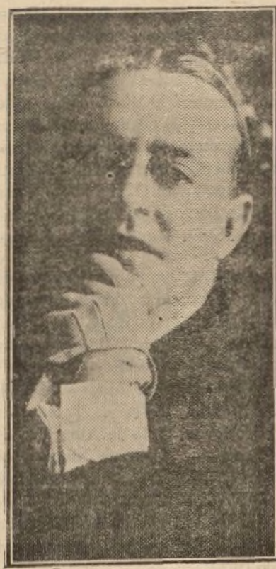
Fernando Porredón, primer actor cómico del teatro Español, que celebra esta noche su beneficio.