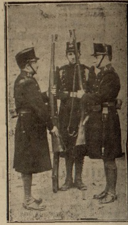
El relevo de la guardia