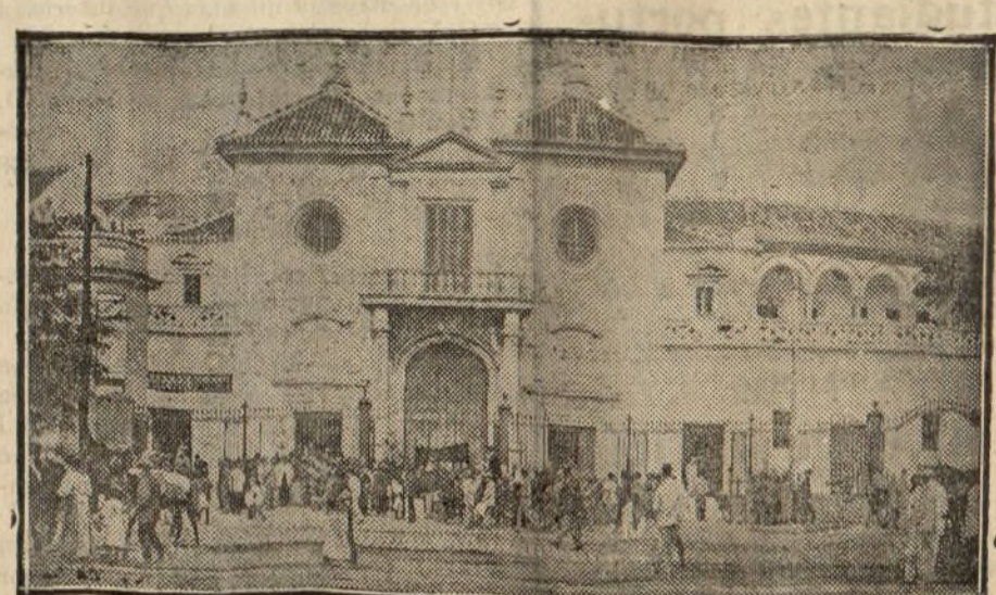
La plaza de toros de la Real Maestranza

Advertimos a nuestros anunciantes, y al público en general, que EL MUNDO no tiene agentes de publicidad, y que sus redactores y empleados administrativos, provistos del correspondiente «cartel», que han de exhibir en todo caso, son los únicos autorizados por la gerencia de EL MUNDO para contratar publicidad. Cualquiera otra persona que se presente en nuestro nombre debe ser rechazada, agradeciendo mucho a nuestros clientes nos avisen en ese caso.