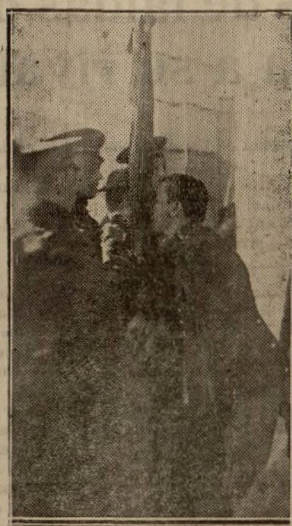
Chicuelo jurando la bandera

Al encontrarnos en Sevilla y analizarla en todos sus matices, en todos sus detalles y en todos sus aspectos, no podíamos sustraer nuestra atención a uno de los más relevantes, de los más característicos: la fiesta de toros. Sevilla ha sido la cuna del toro. De sus típicos barrios salieron las más grandes figuras. Su plaza, la de la Real Maestranza, fué considerada siempre como la de mayor categoría, como la Universidad Central de la tauromaquia, en la que los diestros adquirían la muela doctoral para el ejercicio del arriesgado arte.