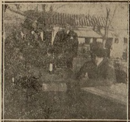
Un cortijo sevillano