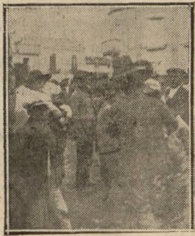
Aguardando el paso de una cofradía

Otro de los más castizos salones sevillanos es EL IDEAL. Artistas de «variedades» de reconocida fama, alternan en el escenario con el mejor cuadro flamenco que se exhibe en Sevilla; a la tonadilla clásica, al cuplé frívolo, sucede la copla andaluza matizada de alegría y de sentimiento.