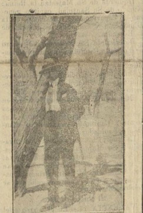
Esté usted muy pendiente del «Fotógrafo misterioso».

Si usted encuentra la suya, no tiene más que dirigirse a la Administración de EL MUNDO, Santa Catalina, 3, entregando derecho, y a la sorpresa que le haya causado ver su retrato en nuestro diario, uno de cuyos ejemplares llevará consigo, le espera otro más agradable.