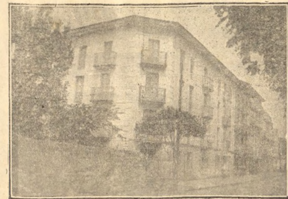
Vista del Hotel de France y Norte Garé, en Irún

Cuenta también con corresponsales en los principales puertos y fronteras de España y del Extranjero.