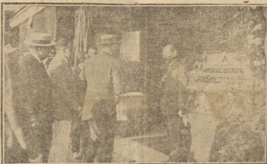
Su Majestad el Rey visitando la notable instalación que en la Feria de Muestras tiene la Sociedad Española de Aparatos Eléctricos P. M. E., de Pasajes, de la que hizo grandes elogios.

Por esta vez no hemos quedado mal como profetas. Auguramos que la temporada del verano en San Sebastián sería brillante, y hemos acertado plenamente. La Bella Easo está animadísima. Los hoteles y casas de viajeros, abarrotados de veraneantes... y «veraneantes».