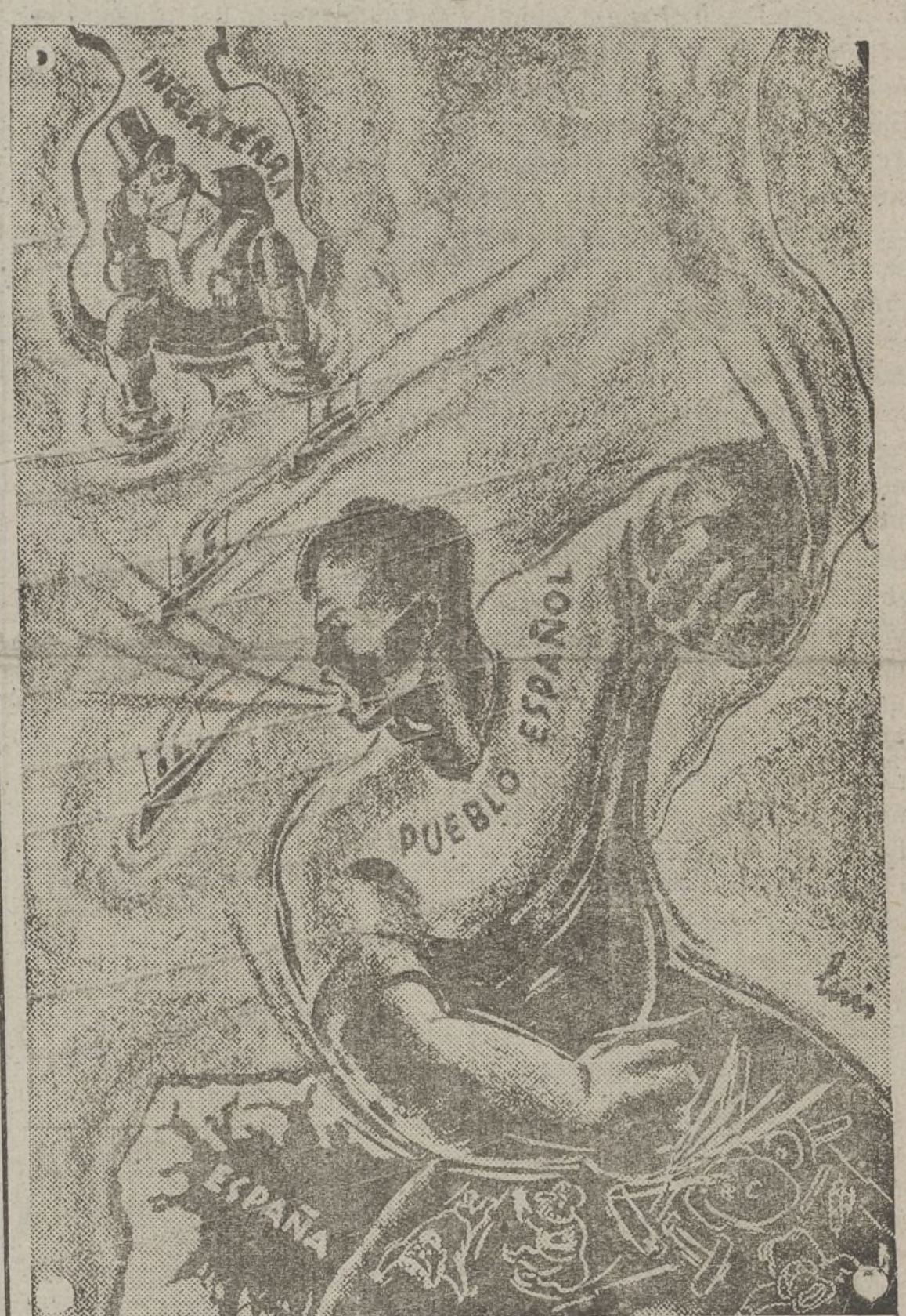
La política sorda de los gobiernos inglés y francés a la descarada intervención de los países fascistas, hace que redoblemos nuestro heroísmo para salvar al mundo.

La pequeña propiedad campesina es digna de toda protección y respeto. La República democrática y popular que defendemos no va en modo alguna contra ella. En algunos pueblos, sin embargo, se han cometido algunos errores que deben subsanarse inmediatamente. La reciente formulación programática del Gobierno contiene la reiteración tajante de este precepto constitucional, que no ha de olvidarse en ningún momento. Lo esencial en estas horas es intensificar la producción agrícola, procurando que no quede ni un solo palmo de terreno yermo. El respeto a la pequeña propiedad no se opone en modo alguno a las Colectividades campesinas, ni siquiera a su desarrollo y consolidación. Hoy no han de restarse ninguna clase de estímulos humanos al trabajo. Que es la acción más eficaz para ayudar a ganar la guerra. Quienes consciente o inconscientemente persigan a los pequeños propietarios, hacen un daño manifiesto a la causa que defendemos y a los intereses supremos de la República.