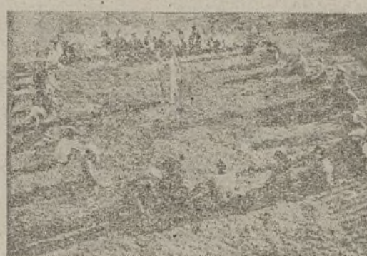
Nuestras camaradas más activas deben celebrar reuniones en todos los pueblos en pro de la incorporación de la mujer al trabajo.

Movilizados los cupos de Trabajadores de la Tierra últimamente llamados a filas, precisa continuar sus trabajos interrumpidos en el campo, intensificándolos, en bien de la República, de manera que sólo pueda notarse la ausencia de ellos en modo afectivo. Ellos cumplen con un deber imperativo, normal y patriótico, que a la retaguardia es obligado completar, sustituyéndolos lo más perfectamente posible. El Gobierno agradece cuanto en este sentido realicen los obreros agrícolas y la población rural en su conjunto. Esto es deber de todos. Para cumplirlo ordenadamente por los Consejos Municipales, se procederá a la reorganización de los trabajos agrícolas propios de la estación, de forma que no queden campos abandonados ni siembras sin los cuidados debidos en toda la provincia. Para este fin se exhorta