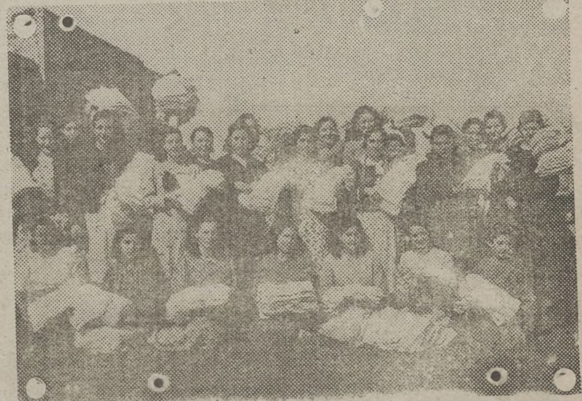
Las mujeres, llenas de entusiasmo, trabajan día y noche confeccionando ropas para nuestros combatientes.