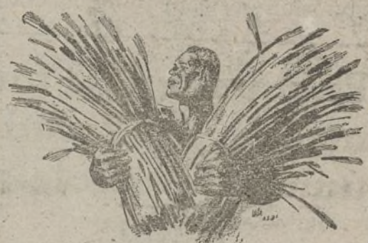
La próxima cosecha es sagrada. Todos tenemos el deber de colaborar en la próxima recolección.

Diariamente se incorporan al trabajo productivo decenas y decenas de mujeres, deseosas de ayudar con sus esfuerzos la sagrada causa de nuestra independencia nacional.