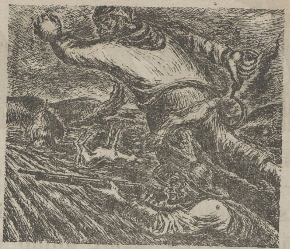
Los campesinos defienden su tierra cada día con mayor coraje de las garras del invasor