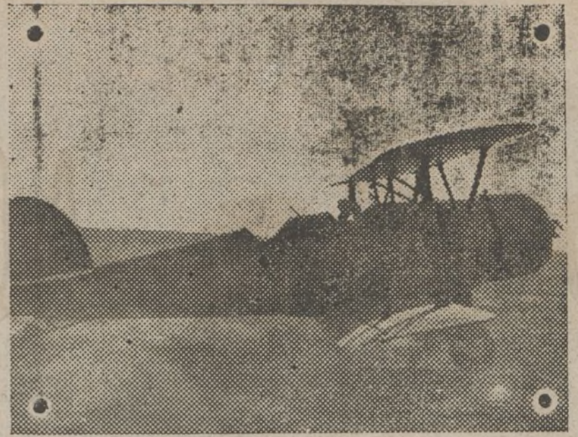
Nuestro heroico y glorioso Ejército Popular rechaza todos los ataques facciosos.

Cansados estamos de leer en todos los periódicos «incorporación de la mujer al trabajo», pero por desgracia en nuestra Cuenca a pesar de los pesares no se ve este llamamiento enteramente cumplido. Si, han respondido a él con muchísimo entusiasmo las campesinas antifascistas de todos los partidos políticos y sindicatos, que ya son bastantes; pero, ¿hemos de ver con indiferencia, tantas otras mujeres de la capital ociosas, que no piensan otra cosa que acicalarse y estar de paseo a todas horas sin preocuparse de la falta tan grande que hacen en los momentos actuales que tan graves son? ¿O es que, las mujeres de la ciudad son diferentes a las camaradas campesinas? ¿No deseáis como todos una España independiente y libre? Pues luchad; ¿cómo? trabajando, ocupando el puesto que el hombre deja libre. ¿Queréis estar bajo el dominio extranjero? No; recapacitar un poco; dejad a un lado esa apatía. Ver la importancia que vuestra incorporación tiene, y a trabajar que el día de mañana, vuestro sacrificio de hoy se verá y os sentiréis orgullosas de haber contribuido a formar la España que todos deseamos; libre y feliz.