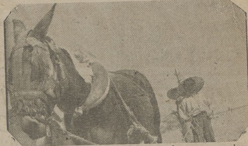
Jóvenes agricultores ocupan los puestos que sus hermanos o padres dejaron al salir para la trinchera. El campo no dejará de producir. Los soldados tienen que alimentarse; los niños y las mujeres han de comer. Los jóvenes agricultores lo saben y trabajan...

Habiéndose constituido en Cuenca la Sección Provincial de la Liga de Mutilados de Guerra, se hace un lla-