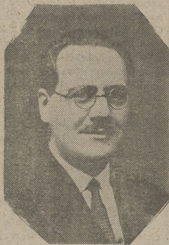
ra don Tomás Bilbao desempeña en la actualidad el cargo de cónsul de España en Perpiñán.