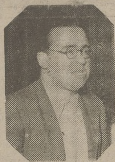
J. S. U.

Cuando llegaron a la vertical de Vesol fueron alcanzados por los haces de luz de los reflectores; inmediatamente un caza propio entabló combate con los aparatos extranjeros. La lucha fue perfectamente visible desde tierra, observándose como uno de los trimotores italianos alcanzado por las ráfagas de ametralladora se separaba de la formación perdiendo velocidad. Este aparato cayó al mar a 6 kilómetros de la costa. Los demás aviones precipitadamente las bombas en el mar huyendo hacia Oalma.