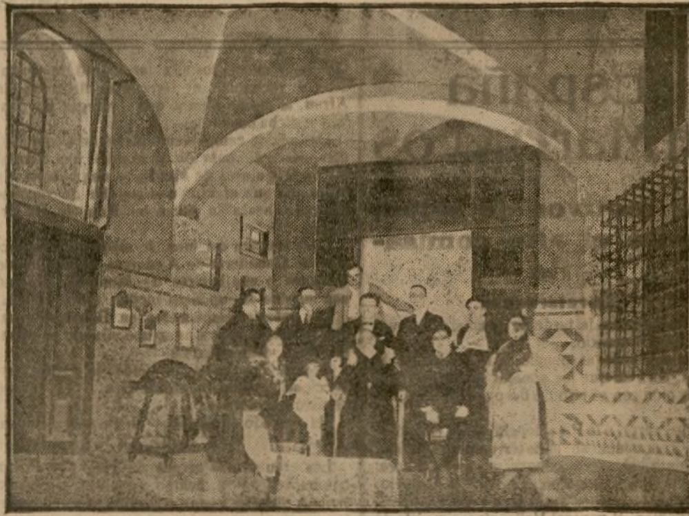
Los felices autores y los afortunados intérpretes de «La sombra del Pilar»

puesto cinco inyecciones una por cada una de las enfermedades que es posible tenga algún día, trepa animoso al cubo en el que se sumerge, gira el eje de la atalaya y vemos subir—sin envidia alguna—al compañero. Lívido a los diez metros, se torna verde a los veinte y violáceo a los treinta. De la cubeta salta un bulto negro que rebota en el suelo: es el borsalino de Mesa. Más tarde, brota un chorro semi-