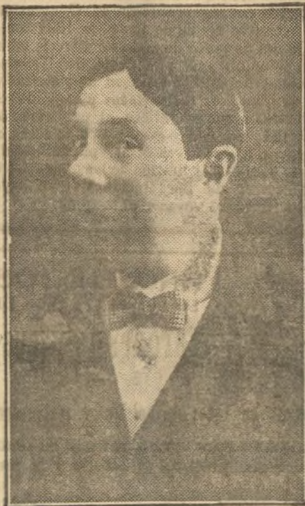
Comedia, de Madrid, durante el próximo mes de Enero.

Este famoso artista, de fama mundial ha sido contratado para actuar en el Teatro de la