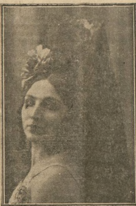
Amarantina, notable bailarina que actúa con éxito entusiasta en el teatro Royal, de Bruselas