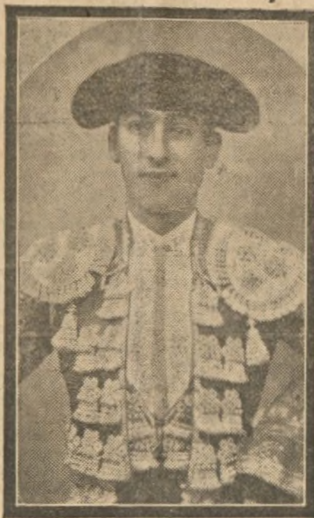
El valiente diestro Maera, fallecido en Sevilla

La noticia nos causó verdadera sorpresa, pues si bien sabíamos que era valiente diestro trianero no estaba muy sobrado de salud, nunca supusimos que su dolencia tendría tan rápida y fatal desenlace. Pero, desventurada