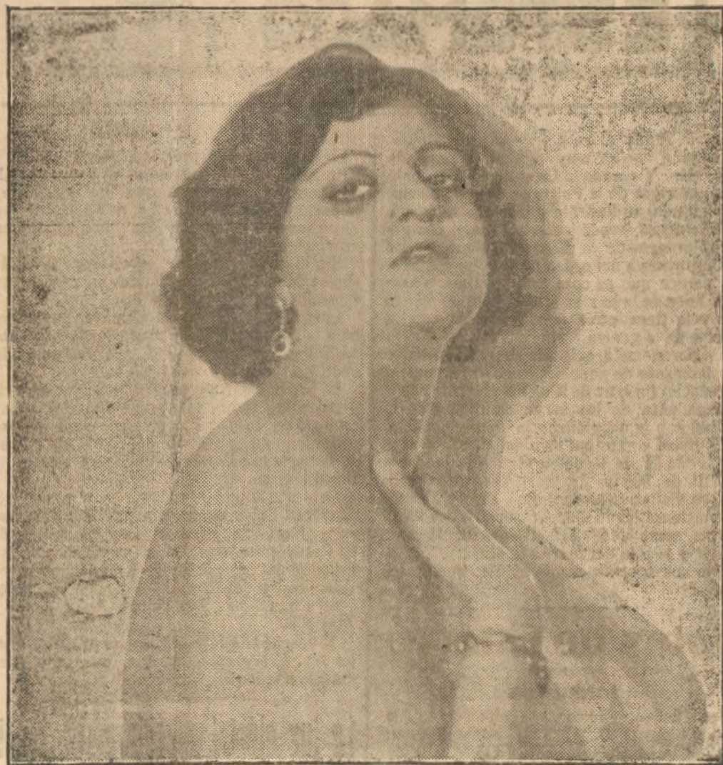
TINA DE JARQUE

Bellísima actriz de la pantalla y eminente canzonetista que ha actuado con clamoroso éxito, en distintos teatros de España y del extranjero. Hace tiempo filmó «Relicario», y en la actualidad está impresionando otra película que se proyectará en París muy en breve.