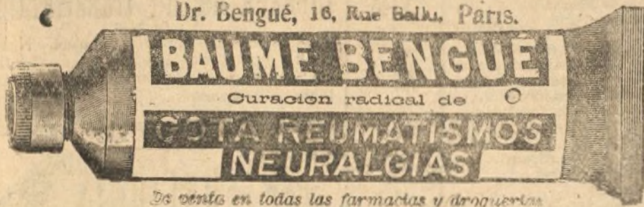
Se vende en todas las farmacias y droguerías.