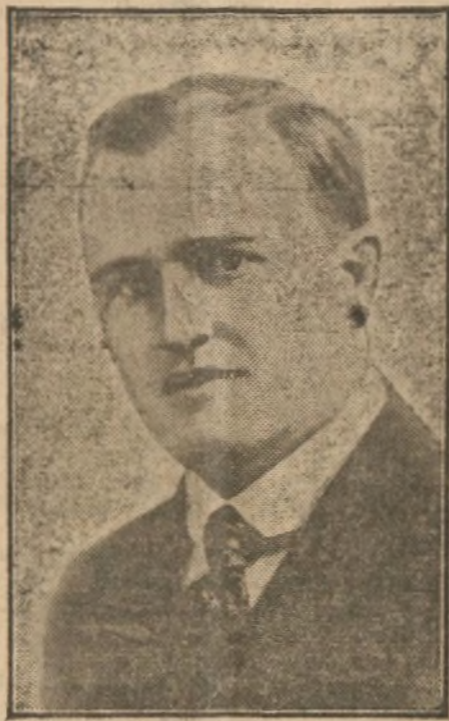
El eminente tenor Ardo Lindt, que ha obtenido un señalado triunfo en su representación en el Real

Este número ha sido sometido a la previa censura