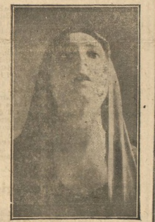
Lola Membrives, la actriz gloriosa, que hoy se de pide del público de Lara, tras una larga y brillantísima actuación

El cine «Pluton», construido a la moderna, todo él de cemento armado y hierro, visto por el exterior no da idea de la magnitud de la catástrofe. Las paredes y techumbre presentan igual aspecto que antes de iniciarse el fuego. Ahora bien; en su interior las huellas de la catástrofe producen verdadero espanto; han quedado estruendos todos cuantos objetos de materia combustible existían en él; las puertas están vencidas, excepto una de ellas que lo gran derribar los espectadores, arrancándola de cuajo.