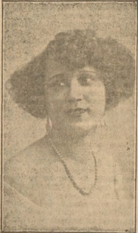
Notabilísima cancionista, que actúa en Rómulo con gran éxito