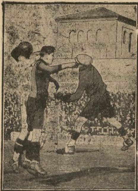
Un momento interesante del partido jugado ayer.