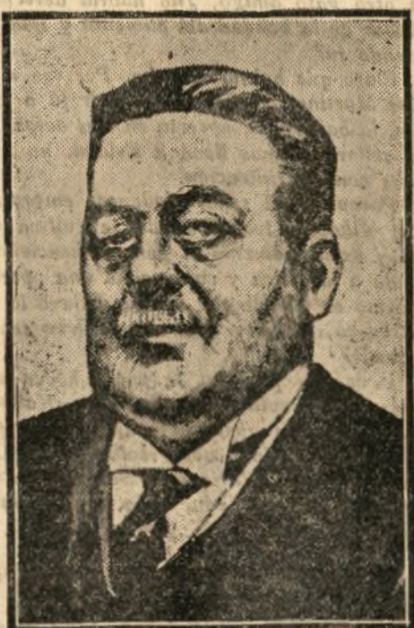
El presidente de la República alemana, Sr. Ebert, fallecido el sábado

La noticia de la muerte del presidente Ebert, que era inesperada en Lon-