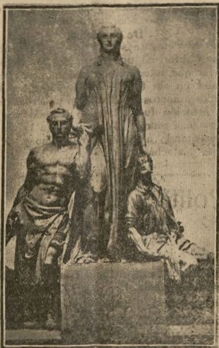
Monumento erigido en Vitoria a la memoria de don Eduardo Dato.

El cadáver no ha podido ser identificado.