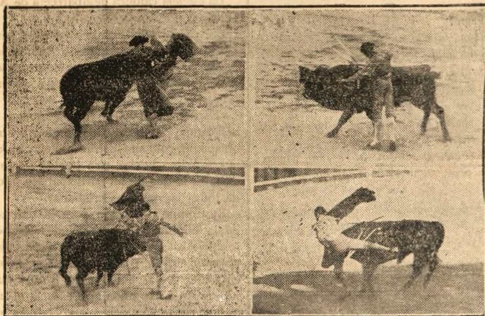
De los pocos momentos salientes de una verónica de Andaluz, un «caso» de Franco y una de las cogidas de ayer, reproducimos natural de La Torre, un pase de cogidas de este último diestro.

La faena, en su primero, la inició con las dos rodillas en tierra, y al intentar el tercer pase fue enganchado por su enemigo, sin consecuencias; después de dos