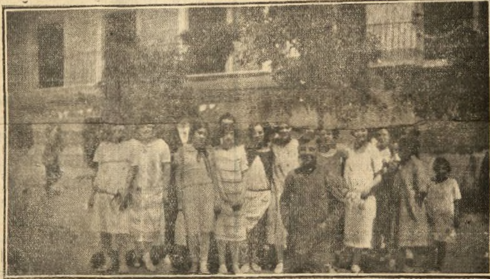
Grupo de bellas colmenareñas, dispuestas a amenizar con su gentileza los festejos del pueblo.