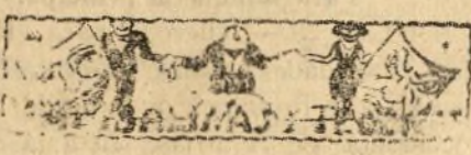
El verdadero «Raffles».