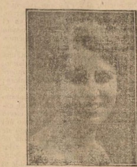
Josefina Díaz de Artigas, genial actriz, que mañana debuta con su compañía en el teatro Reina Victoria.

Mañana, sábado, a las siete de la tarde, y en el salón grande de la Casa del Pueblo, explicará una conferencia el distinguido profesor de Medicina don