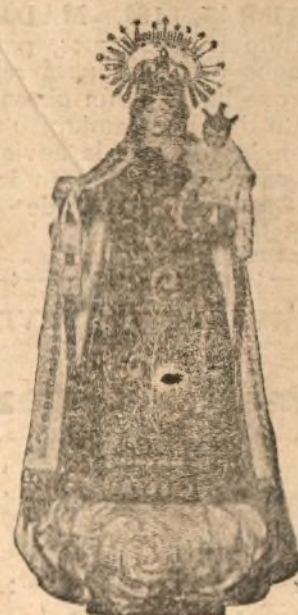
NTRA. SRA. DEL CARMEN

—Usted calle, y deje hacer. Anda, Balbino, hijo—dice el cochero dirigiéndose al caballo—, arrea para la calle de San Andrés. Frente al número 19 te paras. Mi usted, señorito, cómo mueve Balbino el belfo y se relame de gusto y levanta la cola, nada más que de ver que vamos a la calle de San Andrés. Lo que es el «instinto» de los animales. «Den» que una noche le obsequiaran en una «casa» que echan de comer a los señoritos, que la llaman «Petit Restaurant del Barbas», en cuanto se le nombra la calle de San Andrés, reconcho, que relincha. Bueno, es verdad, en cuanto que entra usted en la calle se nota un tufo de comida bien hecha, que alimenta. Como que yo, cuando se me da mal, me voy a la hora de comer a la calle de San Andrés, me pongo frente al «Petit Res-