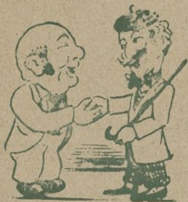
Encuentro de amigos

Hasta luego ¿eh?... y que dentro de poco le vea el pelo en..... casa. Le invito a un té D. Salustiano.