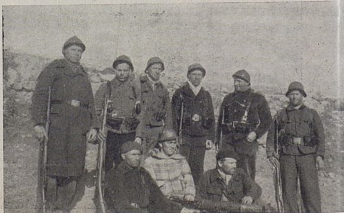
Nasze C. K. M.-y dzielnie się spisali w ostatnich walkach.

Republikanska flota wojenna bombardowała wczoraj Malagę, Mellilę i Motril, zadając nieprzyjacielowi poważne straty.