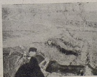
Dabrowszczacy w akcji.