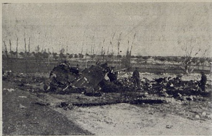
Szczatki rozbitego bombardowca faszystowskiego

Rząd towarzysza Bluma oświadczył publicznie ustami kilku swoich ministrów, że jest zdecydowany zastosować jaknajenergiczniejsze środki wobec faszystowskich prowokacji.