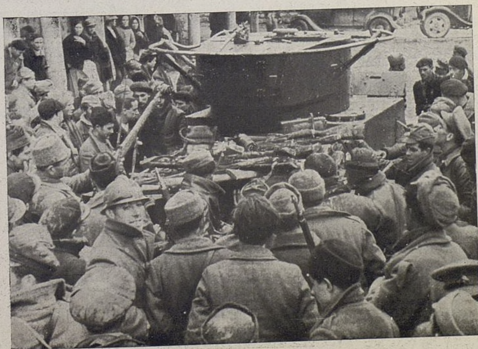
Drobna część zdobytego materiału wojennego na froncie Guadalajara

(Korespondencja Achille Benedetti drukowana w Corriere della Sera dnia 15-9-37 marca.)