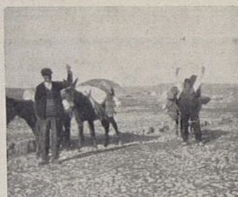
Chłopi witają z radością Armję Republikańską.