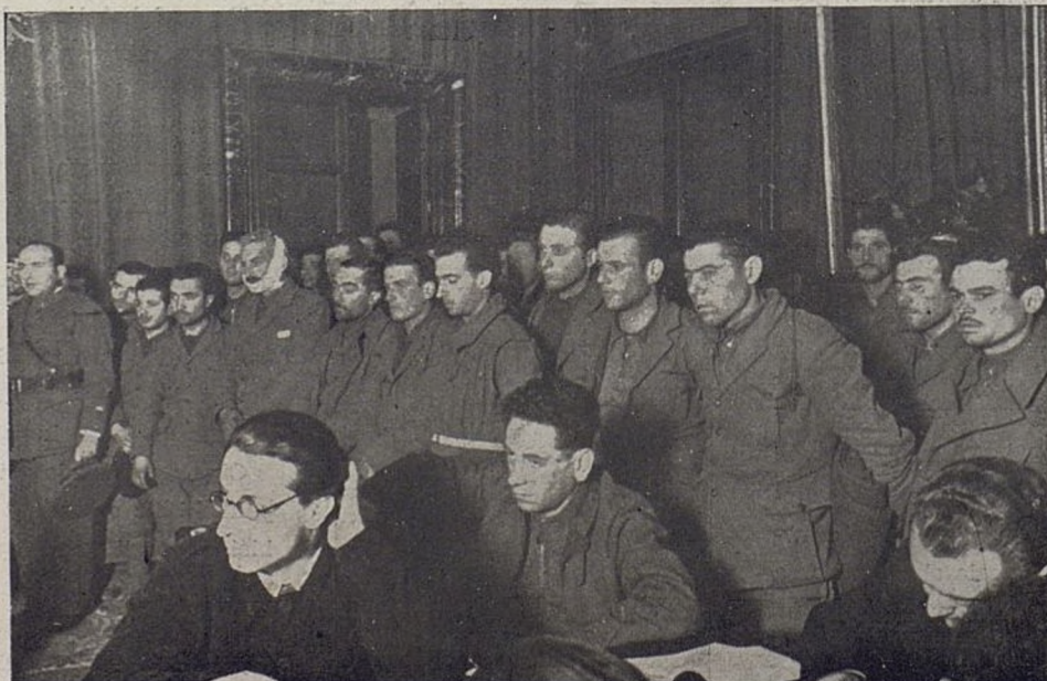
Minister oświaty, Jezus Hernandez, przemawia do grupy włoskich więźniów.