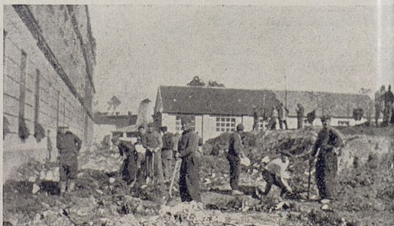
Dabrowszczacy przy pracy.