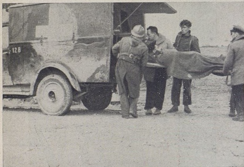
Wielu już naszych towarzyszy padło na froncie walki o wolność. Ich krew nie pójdzie na marne... PASAREMOS!