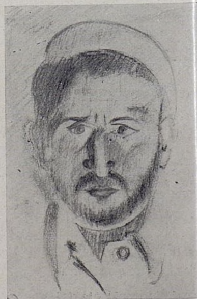
Autoportret (czyli surowa samokrytyka...)