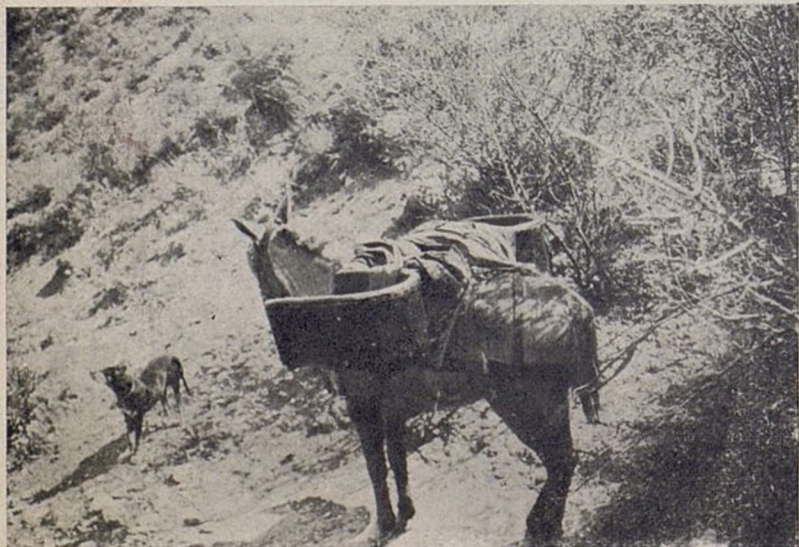
Ze stoickim spokojem, mół przewozi amunicję nawet pod ogniem Karabinów

Jezeli Mussolini i Hitler—widząc że Hiszpania wymyka się im z rąk i że zawalają się ich plany zaborcze—zechcą chwycić wojny, jak tonacy chwytają brzozy, Wy wiecie, co to będzie oznaczało. Faszyzm, przyjąwszy wojnę na terenie Hiszpanii i morderstwa Srodiemnego, zwałiby sobie taką lawinę, z pod której nawet kości „Fuehrerów” nie dałyby się wydobyć. Pisze to nie dla ludzkiego uspakajania Was dla usypiania tyłów. Rozumiem, że walka będzie jeszcze zacięta i nie skończy się może przedko—ale wierzcie, że rewolucyjna potęga ludu Hiszpanii rozwija się potężnie, że do szeregów stało chłopstwo, że faszyzmowi pali się grunt pod nogami i musi on zlamac się tak, jak kontrrewolucja