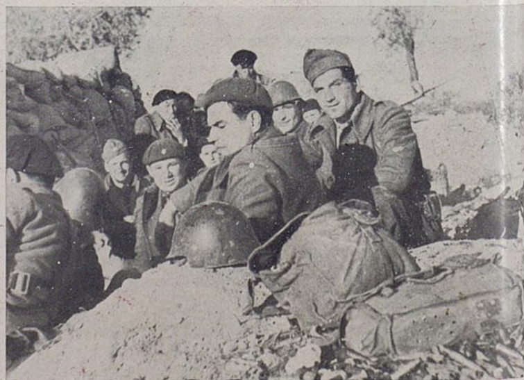
Najczęstszym tematem politycznych dyskusji naszych towarzyszy, to sprawa Frontu Ludowego w Polsce.