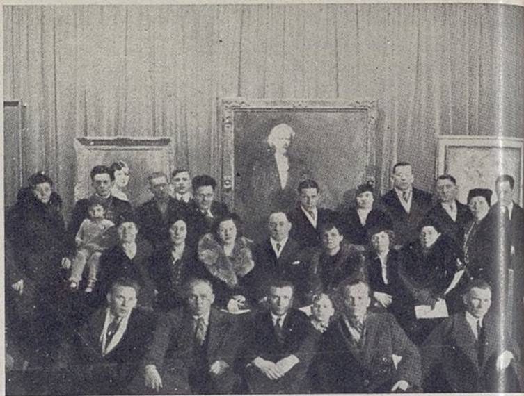
Zarząd Polskiego Towarzystwa Ludowego w Kanadzie.

szczyt oznaczaliby przekształcenie jej w wypadową bazę wojenną przeciw Francji. Otoczywszy Francję Ludowa zbrojnym przesileniem faszyzmu—Hitler i Mussolini mogliby się pokusić nie tylko o wyrwanie Francji z rąk ludu, ale i mieliby wolne ręce najazdu na państwa Europejskie.