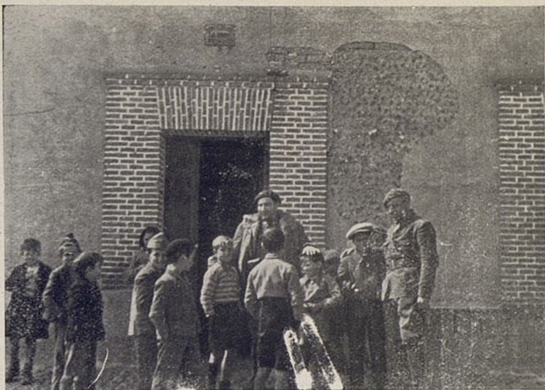
Komendant Bataljonu i Komisarz Polityczny w grupie dzieci hiszpanskich.

W tym samym czasie, rodacy nasi z kraju, przyslali nam 2 sztandary. SZTANDARY TE SA SYMBOLIEM GLEBOKICH WIEZOW JAKIEMI LUD POLSKI JEST Z NAMI ZWIAZANY , jak bardzo