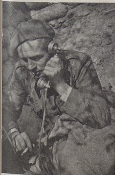
Telefonista na posterunku...

Na drugi dzien, nim slonce wzeszlo, nasi chlopcy juz byli w faszystowskich okopach. Zastalismy jeszcze goraca kawe i jedzenie a faszysci tak uciekali az sobie nosy rozbijali. Bylo tez duzo smiechu u nas gdysmy sie dowiedzieli ze faszystowski sluga w czarnej sukmanie musial uciekac boso i wa kalesonach. Tem wiecej radości bylo w naszej kompanji zesmy