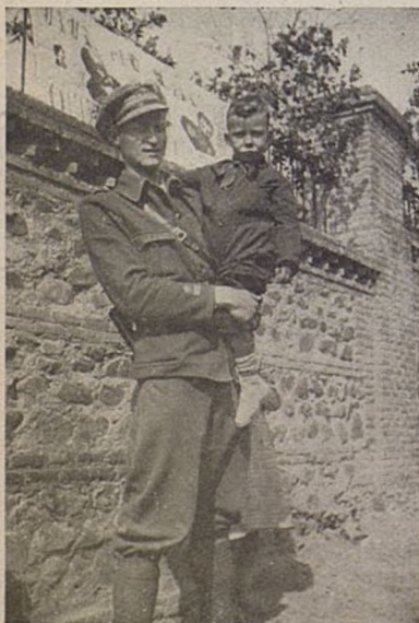
Najmniejszy i największy...