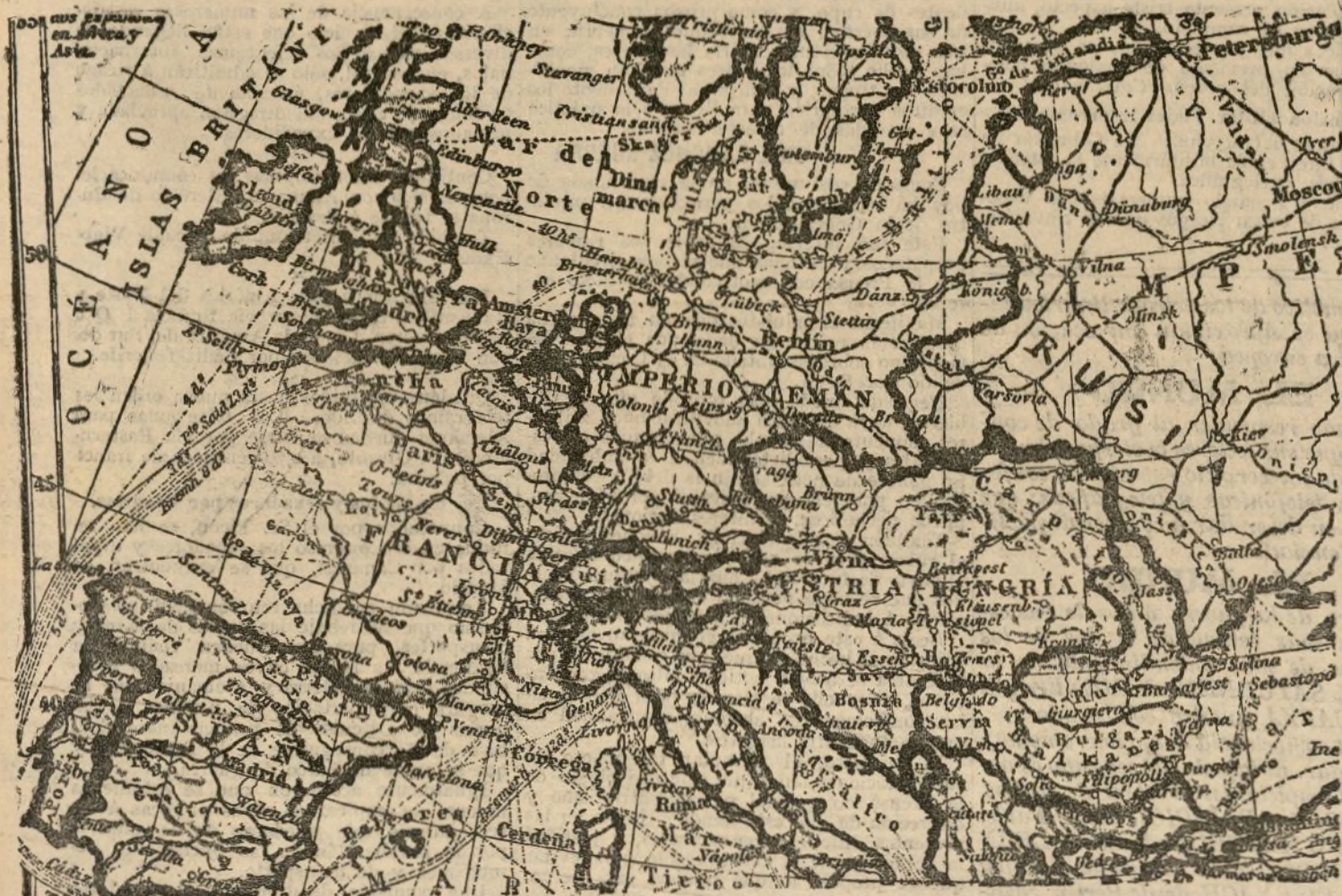
Mapa de las naciones que juegan en el actual conflicto europeo, con expresión de las rutas de los barcos y tiempo que tardan en la travesía.