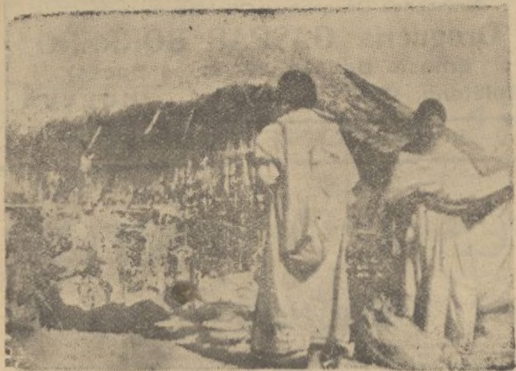
El bombardeo de las fuerzas de aviación italiana, causó en Dessie considerables daños. He aquí una choza incendiada. Después del bombardeo los nativos se dedicaron a remover los escombros en busca de víctimas. Dessie, ha quedado casi totalmente destruido. El número de víctimas ha sido reducido debido a las precauciones tomadas por el ras Tafari, que hizo evacuar la población días antes de que diera comienzo el bombardeo.

No hay regalo más práctico para REYES, que una de pluma Stilográfica de las que vende la Papelería DIARIO DE HUELVA