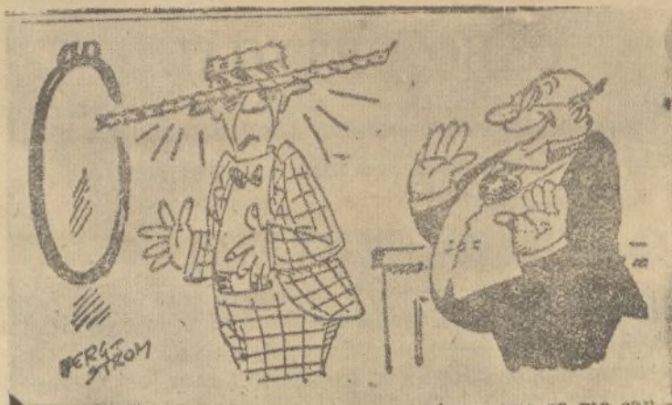
—Si, el sombrero es bonito; pero temo que se me cansen las orejas.