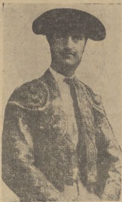
Villalta, el famoso matador de toros, que ha decidido no volver a torear en España

Sección continua de 11 mañana a 2 tarde.-Butaca, 050.