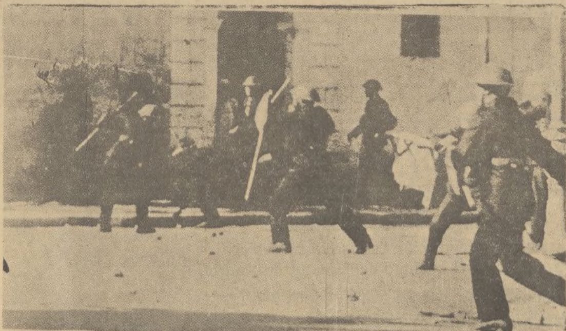
Manifestaciones de carácter nacionalistas promovidas por los estudiantes en El Cairo que han dado lugar a nuevos disturbios. Los agentes de Policía, a quienes los estudiantes atacan a pedradas, se han provisto de escudos para defenderse de las agresiones y de cascos metálicos protectores. He aquí a los policías después de disolver una manifestación