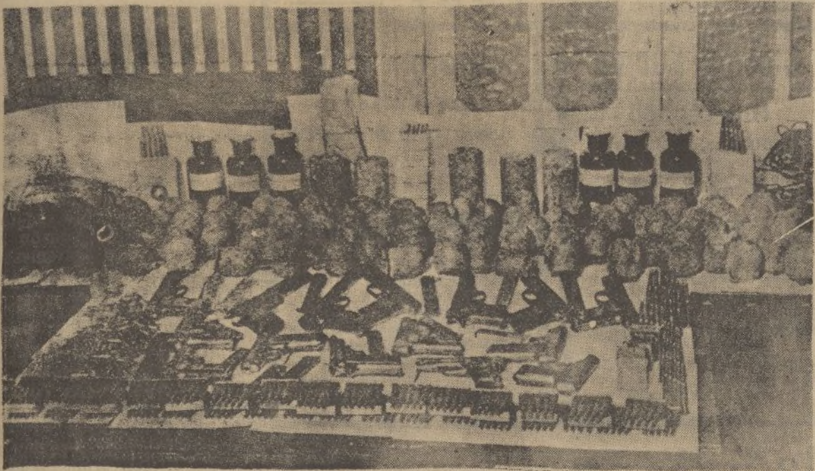
La policía de Zaragoza ha descubierto, en un obrador de dulces, un depósito de ciento ocho bombas y numerosas armas y municiones.