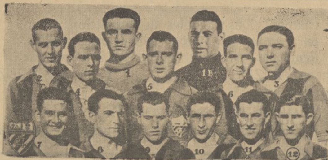
El Arenas, que en el partido del domingo empató a uno con el Júpiter