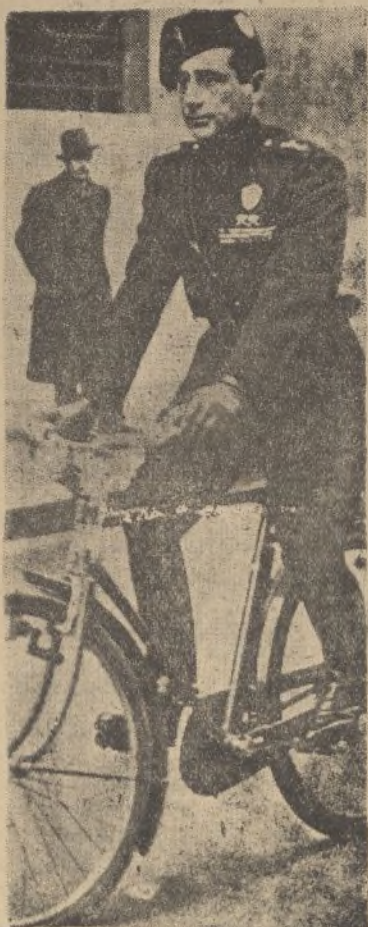
El secretario del partido fascista, señor Staraci, jefe del movimiento antisancionista, ha prescindido de su automóvil para economizar gasolina, y emplea una bicicleta

«Thrasylrenlus», griego, para Gante, con mineral. «Hércules», alemán, para Oporto, con carga general. «Biskaya», español, para Rotterdam, con mineral. «Sac 7», español, para Tarragona, con mineral. «Ophir», noruego, para Amherst, con mineral.