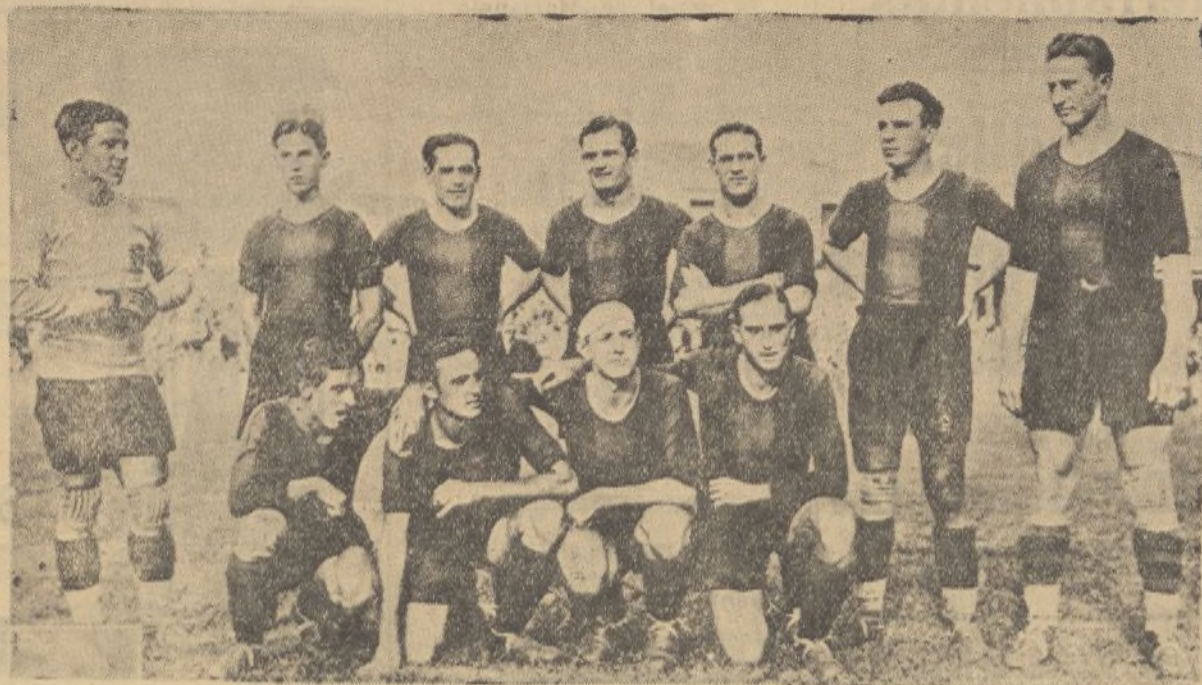
El F. C. Barcelona, que perdió por 2-0 contra el Betis Balompié