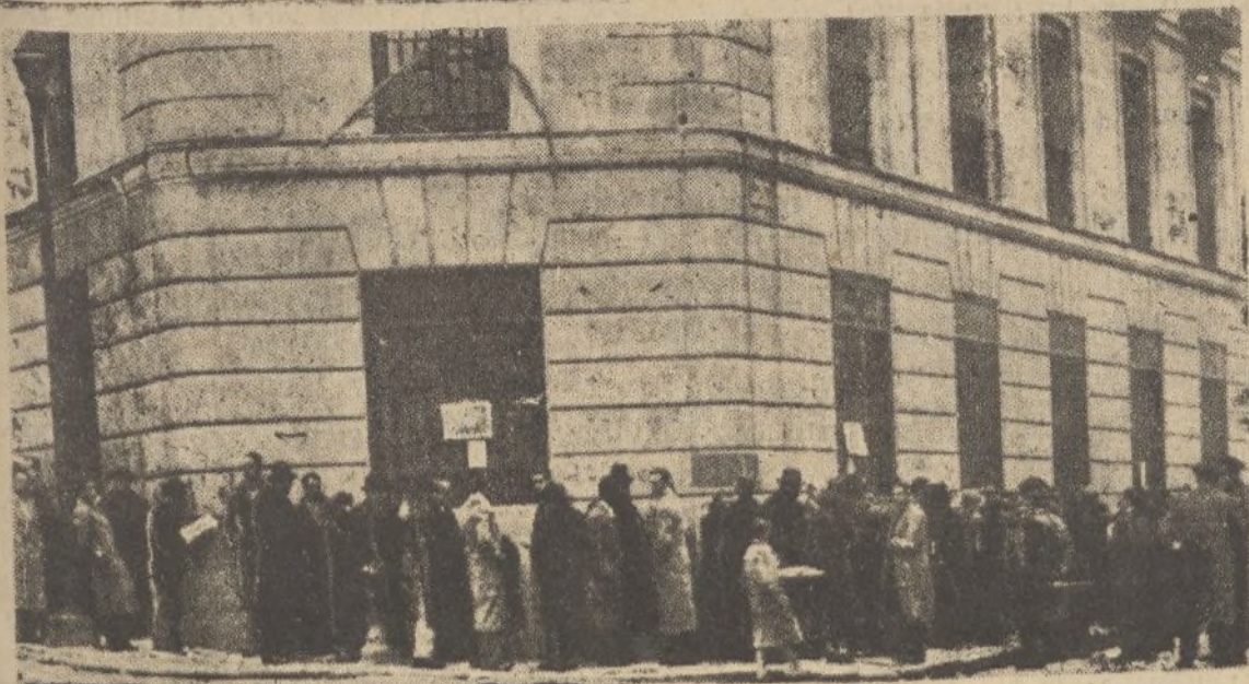
En vísperas de elecciones los madrileños se apresuran a proveerse de cédulas personales, formando largas «colas» ante las oficinas correspondientes

Ello releva a la Falange de todo escrúpulo de perturbación que le aconsejara prolongar la espera. Por consiguiente, con sus propias fuerzas (abiertas a todo contacto admisible) y bajo su entera responsabilidad, iniciará enseguida la propaganda del FRENTE NACIONAL, con candidaturas propias, en Madrid (capital) y en dieciocho provincias.—Madrid 8 de Enero de 1936».