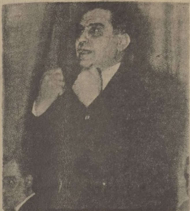
En el Palacio de la Música pronunció el domingo su anunciado discurso de propaganda política el jefe de los republicanos conservadores, don Miguel Maura.