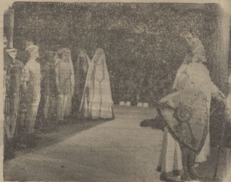
Uno de los instantes de mayor lucimiento del tenor Benjamino Gigli en la producción inglesa de Cifesa, «No me olvides»

Antonio Moreno viene contento y agradecido a su país, que ha sabido acordarse de él en el momento que se le necesitaba. A unas preguntas de los reporteros hizo manifesta-