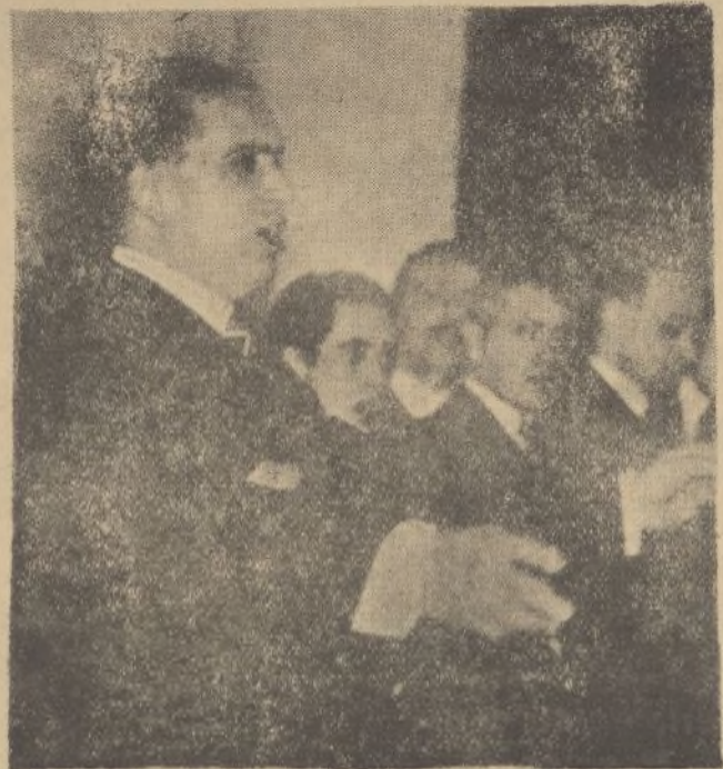
En el cine Madrid se celebró un acto de propaganda de los monárquicos, pronunciando un discurso el señor Calvo Sotelo