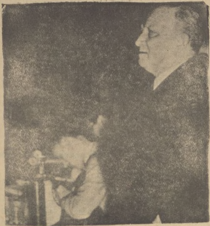
En el cine Europa de Madrid, tuvo lugar un acto de propaganda socialista, en el que habló el señor Largo Caballero.

Papel de fumar de todas marcas los encontrarán en la Papelería del DIARIO DE HUELVA