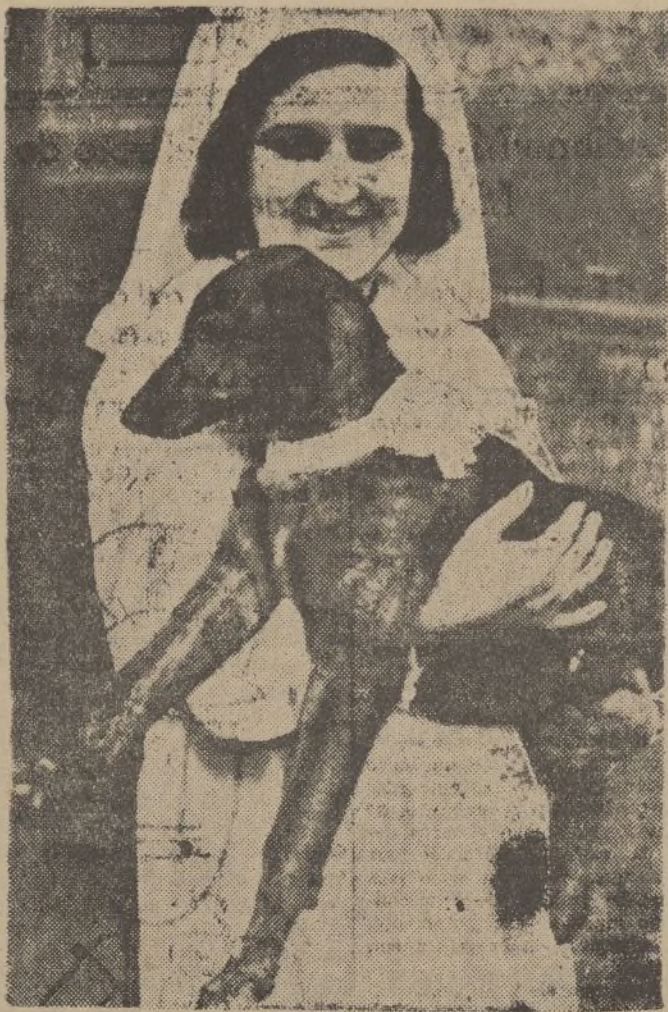
Un perro herido de una pedrada se presenta en el Hospital Provincial de Madrid, recorre salas y pasillos hasta que encuentra una enfermera que lo atiende y cura.