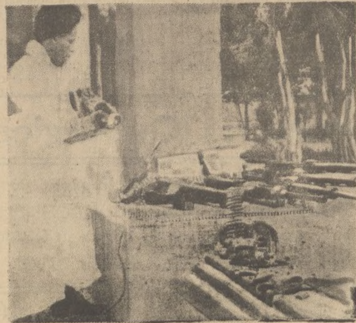
Un etiope examina las armas y municiones cogidas a los italianos en los últimos combates