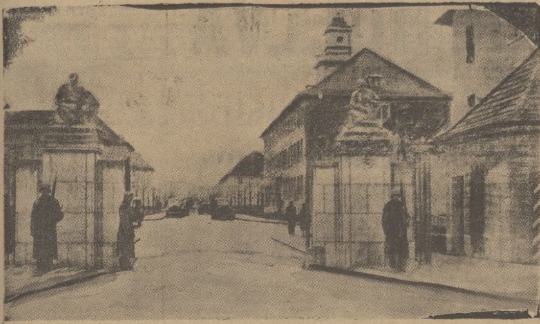
Una vista de la célebre Academia Militar de Potsdam, donde se formaron las últimas generaciones y las más gloriosas figuras bélicas de la Alemania imperial; había sido cerrada por imposición del tratado de Versalles. Hitler acaba de abrirla y se ha inaugurado el primer curso.