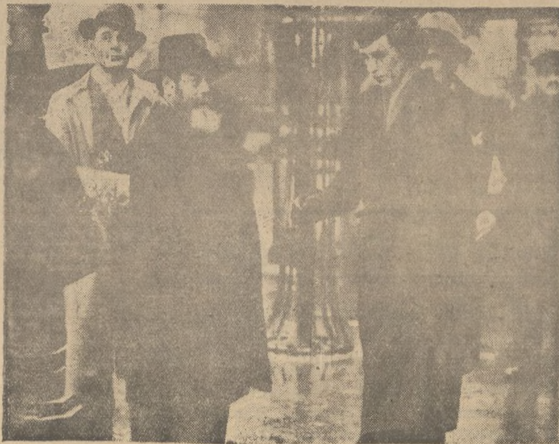
La famosa Arlette Staviski, con el traje característico de viuda, al salir del Palacio de Justicia, en París, absuelta por el Jurado

Condiciones para proveer mediante concurso una plaza de Perito Aparejador de Obras.